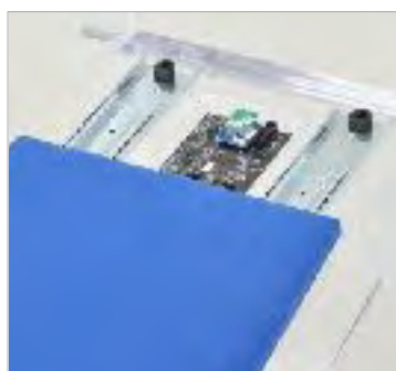
椅子のシート部分にセンサを搭載。 スライドレールを引いてマイコン付基板を着脱可能。