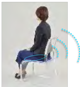
座っている人の健康状態（心拍、呼吸数、ストレス度）モニターで確認。